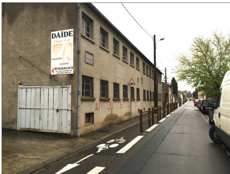
Vue sur le bâtiment atelier depuis l'avenue Roquefort